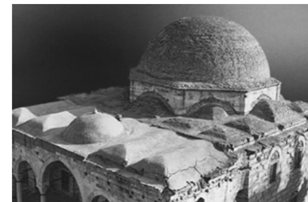
View of Zircirli Mosque