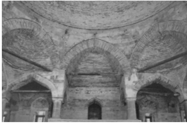
Τέμενος Ζιντζιρλί, ο κεντρικός τρούλος. Zincirli mosque, the main dome.