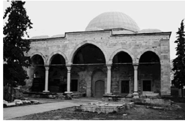
Τέμενος Ζιντζιρλί, η πρόσοψη μετά το πέρας των εργασιών. Zincirli mosque, view of the facade post-conservation works.